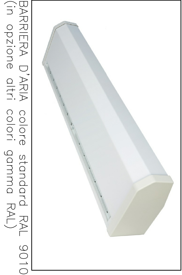
BARRIERA D'ARIA colore standard RAL 9010 (in opzione altri colori gamma RAL)

PROVINCIA DI BELLUNO COMUNE DI BELLUNO RESTAURO CONSERVATIVO DI PALAZZO CREPADONA DESTINATO ALLA NUOVA MEDIATECA DELLE DOLOMITI • PROGETTAZIONE ESECUTIVA DEI LAVORI DI RESTAURO, OPERE EDILI, STRUTTURALI, IMPIANTISTICHE E COORDINAMENTO DELLA SICUREZZA IN FASE DI PROGETTAZIONE