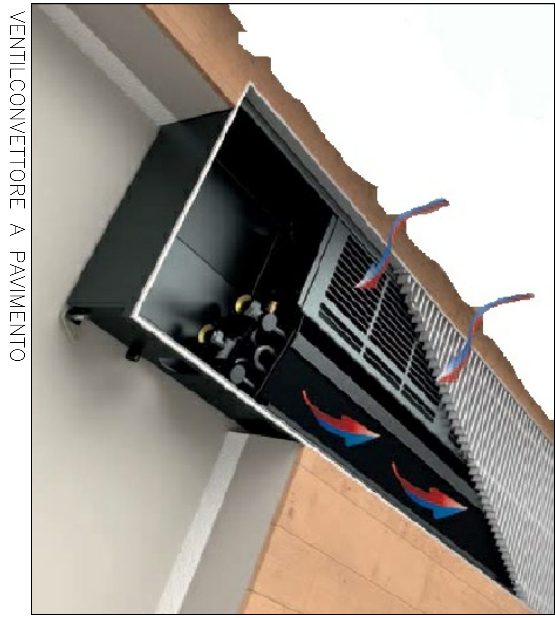
VENTILCONVETTORE A PAVIMENTO